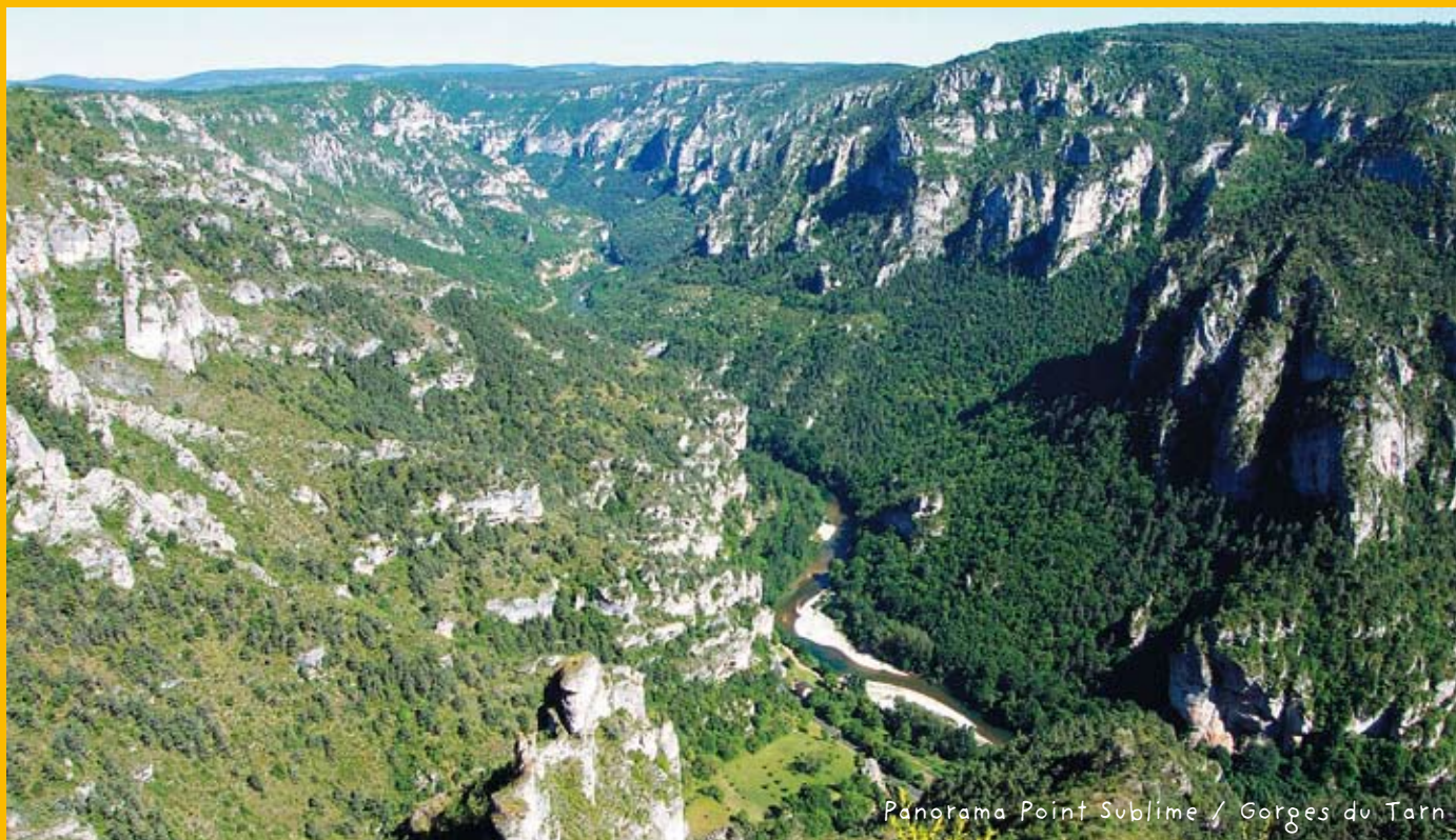
Panorama Point Sublime / Gorges du Tarn