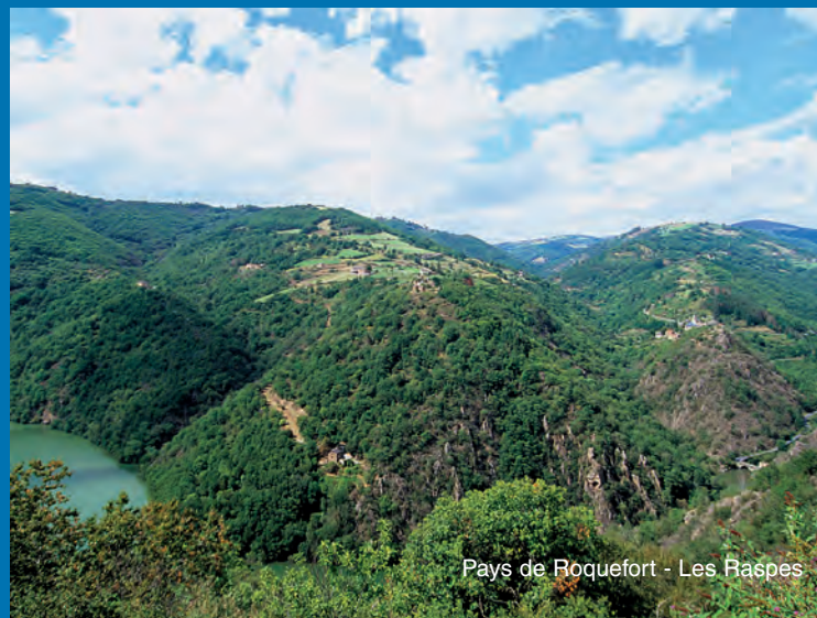
Pays de Roquefort - Les Raspes

L'hôtel vous offre la possibilité de passer un agréable séjour dans une ambiance familiale. Le cadre chaleureux de son restaurant vous permettra d'apprécier une cuisine régionale élaborée à partir des meilleurs produits régionaux. Vous apprécierez le calme et le confort de ses 20 chambres entièrement rénovées avec douche, wc, téléphone, télévision et la détente dans le parc ombragé.