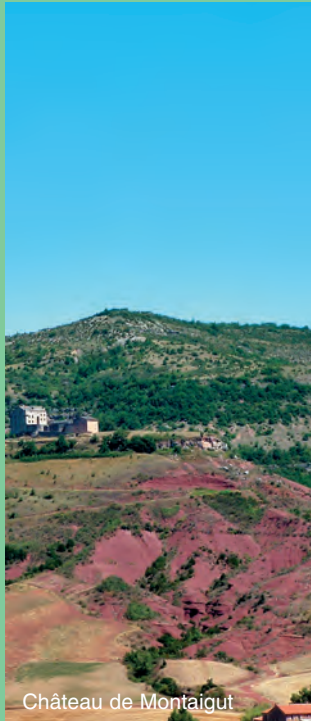
Château de Montaigut