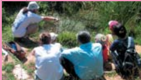
Détails page 23

Dans le village pittoresque de Saint-Léons, visitez la Maison Natale de Jean-Henri Fabre (1823-1915), véritable trésor témoignant de la vie rurale au XIX e siècle, promenez-vous sur le sentier botanique et au jardin d'insectes et découvrez l'histoire de ce village pittoresque en déambulant dans ses rues. Ouverture tous les jours en juillet/août, sur rdv hors saison.