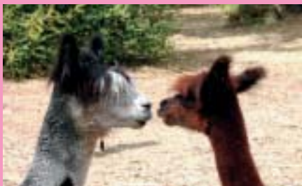
Détails page 23

Dans un parc boisé de 9 ha, partez à la rencontre d'animaux étonnants (Alpagas, Yacks, Highlands...). Un lama pourra vous accompagner sur ce parcours ombragé de plus de 2 km. Sentier botanique - Aire de pique-nique.