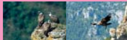
Détails page 22

En plein cœur des gorges de la Jonte dans un cadre grandiose, venez visiter la Maison des Vautours. Un des 9 sites « incontournables » de la région. Vous découvrirez sur ce site un musée de 1000 m 2 relatant la fabuleuse histoire de la réintroduction du Vautour (une première mondiale réalisée dans cette vallée en 1981). Vous pourrez admirer un superbe panorama (site classé) sur les Détroits de la Jonte. Une grande plateforme avec longues vues vous permettra d'observer les grands rapaces dans leur milieu naturel et enfin point d'orgue de la visite dans une salle de vidéo-transmission : nous vous présenterons des images en direct de caméras interactives placées sur les sites stratégiques de la colonie des vautours (nid perchoir, lieu d'alimentation) ainsi que les meilleures images enregistrées ces dernières années, le tout commenté par un animateur passionné.