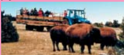
Détails page 22

Dans un décor digne des meilleurs westerns, sur le Causse Noir, venez faire un voyage au pays des bisons. Dans un chariot, en toute sécurité, vous découvrirez le troupeau et les petits qui naissent à chaque printemps. Vous pourrez aussi déguster la viande et les charcuteries de bison dans la ferme-auberge et dormir en chambre d'hôtes dans une maison en bois ou sous un tipi ! Spectacle de tri du bétail tous les mercredis soir en juillet et août et nombreuses autres animations tout l'été : soirées line-dance, compétitions équestres, concerts country,... programme à découvrir sur notre site internet.