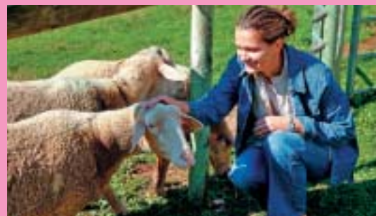
Détails page 22