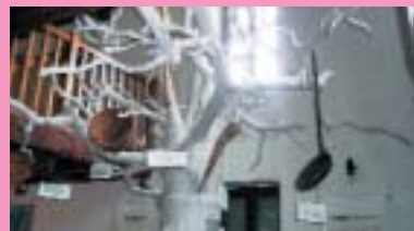
Détails page 22

Partez à la découverte de l'arbre à pain et de son fruit, base autrefois, de l'alimentation dans nos zones rurales. Sur 140 m 2 vous suivrez toutes les étapes : de la maturité du fruit à sa transformation ainsi que les usages de l'arbre en bois d'œuvre. 40 m 2 d'exposition sur l'Art Religieux dans nos campagnes complètent ce site ludique. Pour les amoureux de la nature partez à l'assaut du Roc St Jean, citadelle du vertige, qui domine la Vallée des Rapses du Tarn et qui enchantera vos sens.